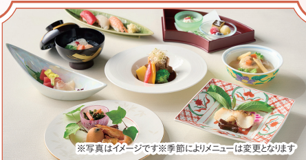
※写真はイメージです※季節によりメニューは変更となります