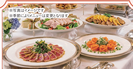
※写真はイメージです※季節によりメニューは変更となります

【期間】2026年4月1日(水)~2027年3月31日(水) 【対象】公立学校共済組合埼玉支部組合員、被扶養者 【料理内容】前菜/蒸し物/魚料理/肉料理/本日の蕎麦/デザート/コーヒー ※アレルギーのある方は、ご相談ください