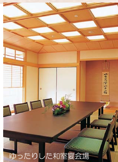
ゆったりした和室宴会場

お子様 ¥3,500 (税・サービス料込) (和洋各一段、デザート、おもちゃ付き)